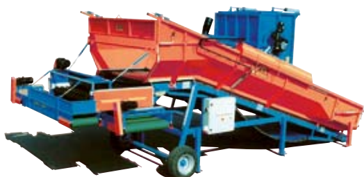
Mottag från vagn och låda

EMVE konstruerar och tillverkar mottag för lådor, storsäckar och vagnar. Fyllning i låda storsäck och silobuffert finns i olika varianter.