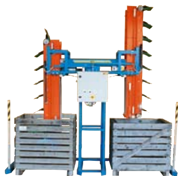
Låd- och storsäcksfyllare