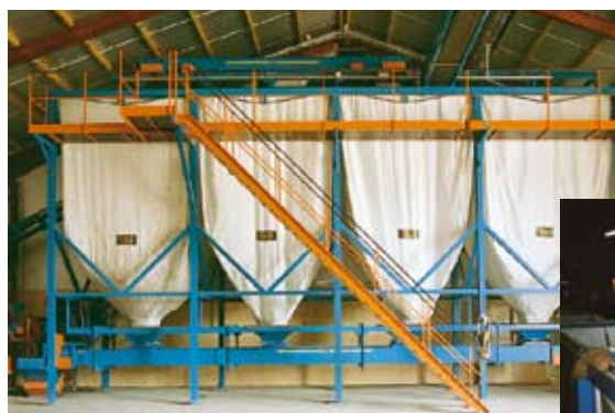
Silobuffert, 1–25 m 3