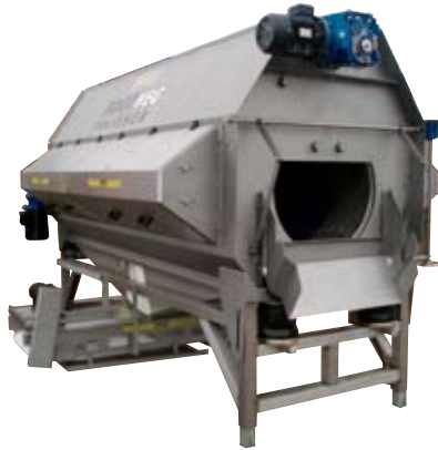
Polering 1–25 t/t

EMVE bygger kompletta tvättlinjer för potatis, morötter och andra grönsaker.