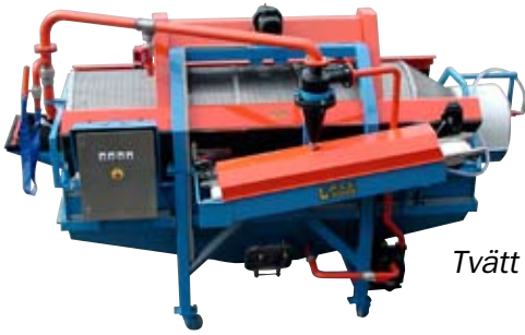
Tvätt 1–15 t/t